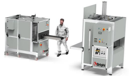
HF-100 + LF-100