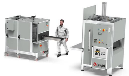
HF-100 + LF-100