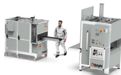
HF-100 + LF-100